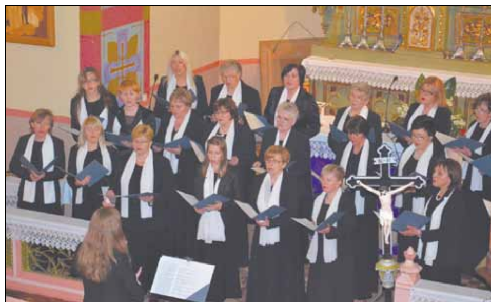
III m. CANZONA z Olesznej

Sprzedam budynki gospodarstwa rolnego wraz z domem mieszkalnym na działce o pow. 0,25 ha w Sienicach gmina Łagiewniki pow. Dzierżoniów.