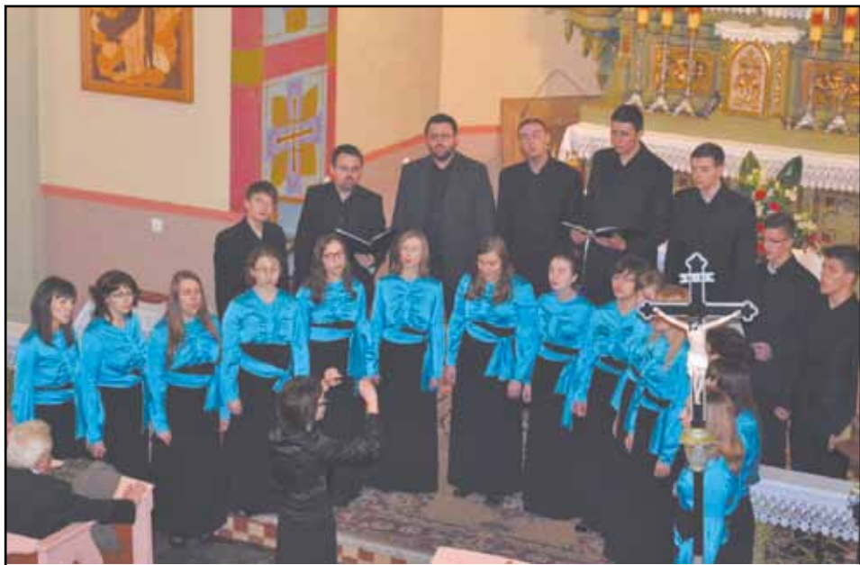
I m. ANIMATO z Pawłowic